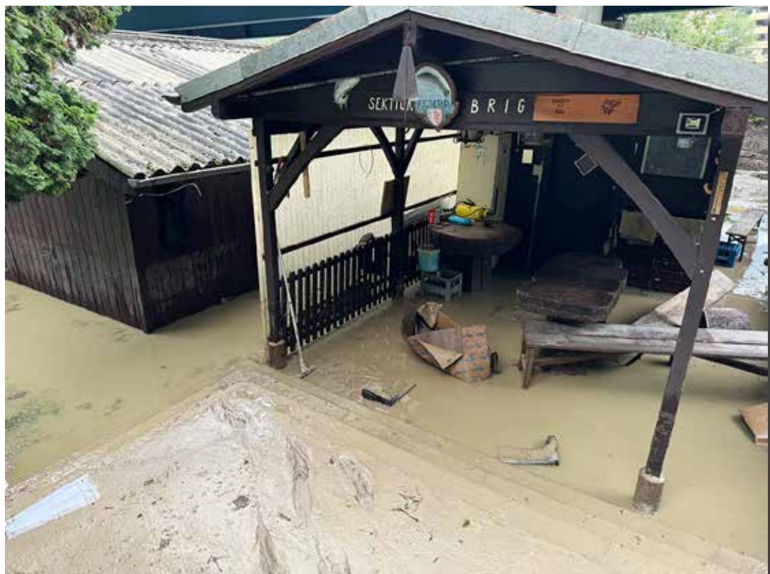
Fischzucht Naters am Morgen nach der Überschwemmung!

Doch das Unglück wollte nicht enden. Wir verloren viele Fische – Jungtiere und ausgewachsene Exemplare bei der Überschwemmung in Naters. Der Ausfall der Belüftung, die Verschmutzung und die Überschwem-