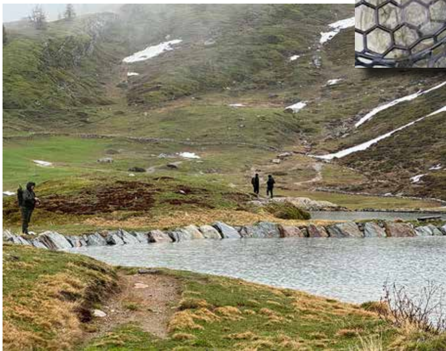
Rotelsee am Eröffnungstag