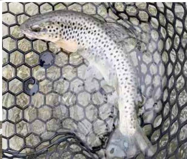
Rotelsee - Forelle vor dem Besatz