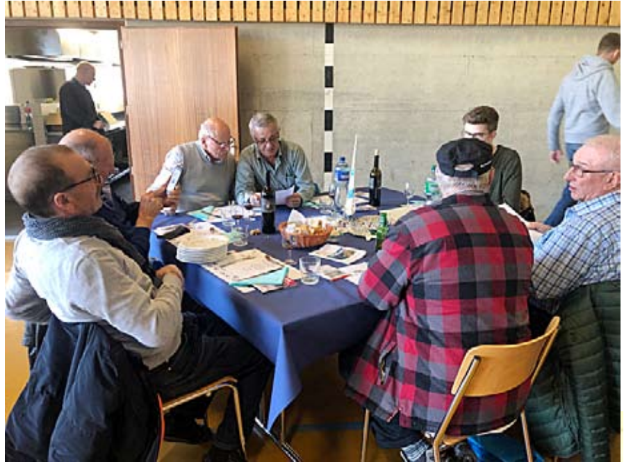
Die Briger Delegation